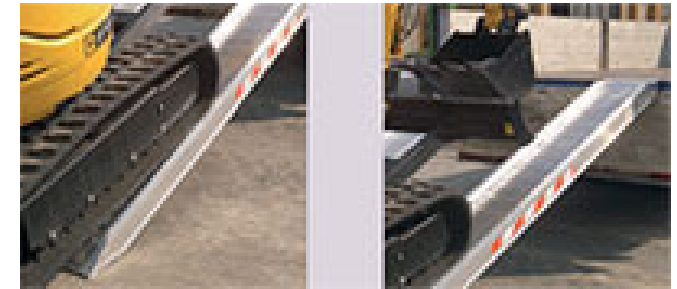
Verladeschienen mit und ohne Rand, Traglast von 2000 bis 6000 kg / per Paar