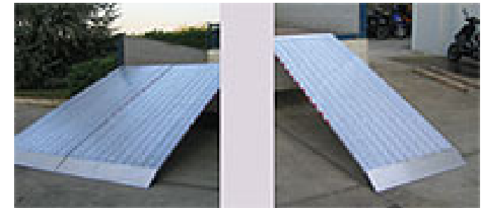
Verladeschienen ohne Rand, Traglast von 200 bis 2900 kg / per Paar