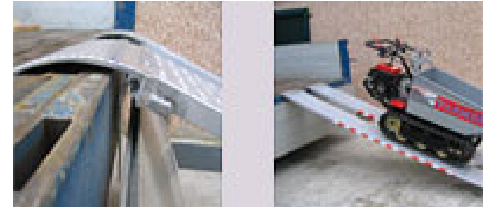
Verladeschienen ohne Rand, Traglast von 200 bis 2900 kg / per Paar