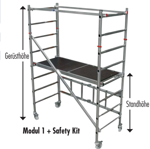
Modul 1 + Safety Kit